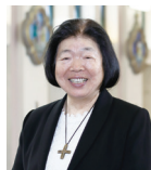
大学コンソーシアム岡山第11期会長

大学教育事業部、社会人教育事業部、産学官連携事業部を擁し、教育・研究力と地域力の一層の向上を目指す事業展開に向かって鋭意取り組みを進めています。